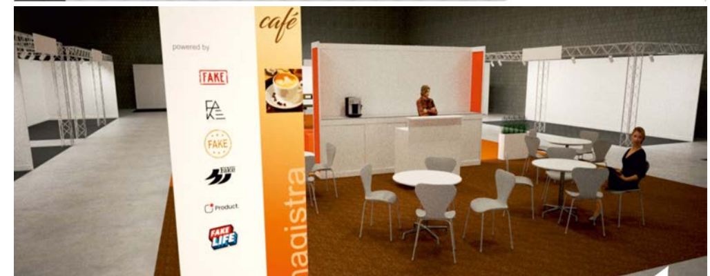
Beispielbilder die Umsetzung variiert je nach Möglichkeiten