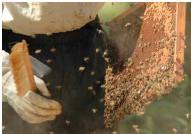
Imker bei der Arbeit.