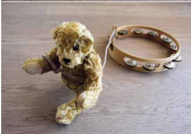
Auch der Bär macht mit!